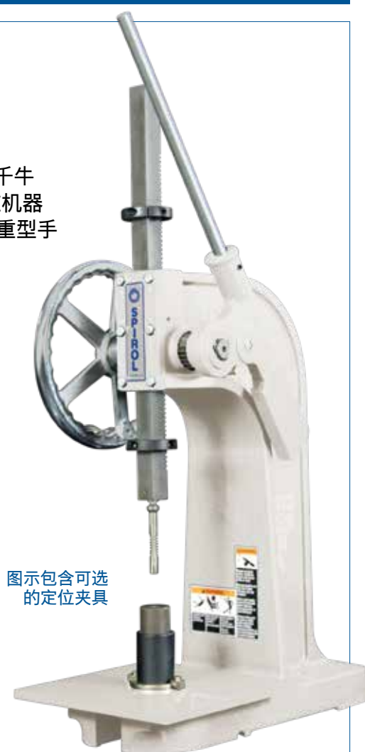
图示包含可选的定位夹具