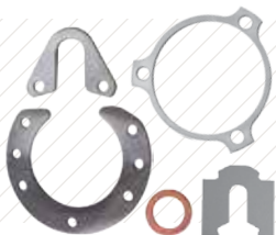
精密金属垫片和高磨损组件