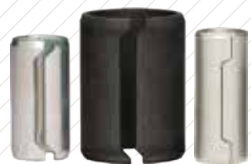
弹性定位销/定位衬套