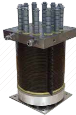
含碟形弹簧组合结构的电 解槽