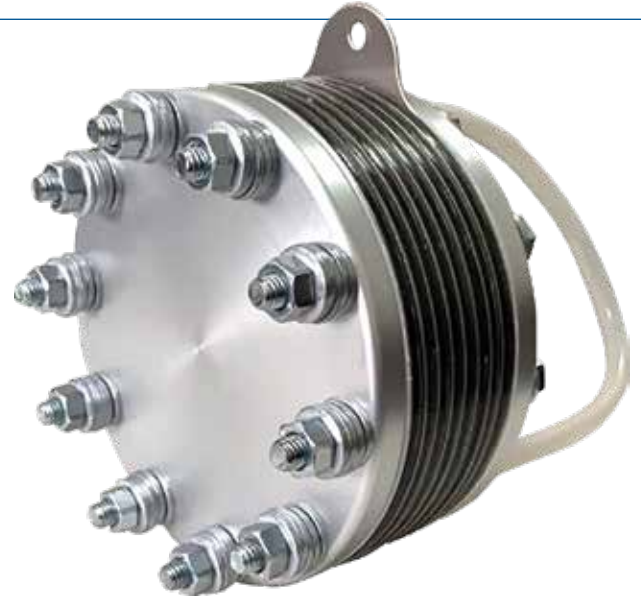
示例: 预叠合碟形弹簧 电解槽的弹簧